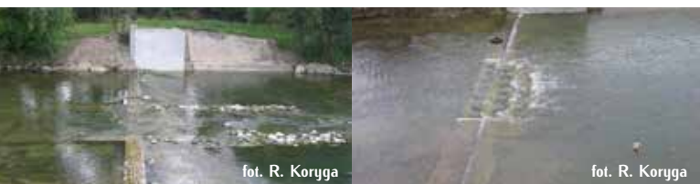
fol. R. Koryga

Ponadto, na podstawie analizy historycznych zmian koryta w ciągu ostatnich 130 lat i aktualnych trendów jego rozwoju wybrano dwa odcinki rzeki Białej (w Kąclowej i pomiędzy Pleśną a Bogoniowicami), dla których opracowano koncepcje „bliskich naturze” rozwiązań stymulujących migrację koryta rzeki i ograniczających jego erozję w głąb. Na granicy korytarza swobodnej migracji rzeki zaproponowano realizację tzw. „spiących zabezpieczeń” tj. rowów wypełnionych materiałem kamiennym, mających stanowić granicę, do której rzeka może swobodnie erodować i kształtować swoje brzozi.