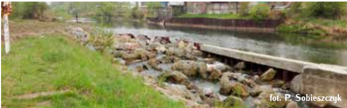
Bystrotok przy stopniu w km 107+200 Wisłoki w miejscowości Jasto.

Udrożnienie stopnia w m. Jasto w km 107+200 rzeki Wisłoki, przy ujęciu wody dla Rafinerii, polegało na wykonaniu przy prawym brzegu rzeki bystrotoku kaskadowego, o szerokości około 10 m. Urządzenie to, składa się z nieregularnie rozmieszczonych basenów. Przy niskich i średnich przepływach, woda pomiędzy basenami przepływa poprzez specjalnie w tym celu wytworzone szczeliny. Wielkość, rozkład i ilość szczelin została dobrana w sposób zapewniający zachowanie optymalnych warunków dla większości migrujących gatunków, przy jak największym zakresie przepływów w korycie. Baseny połączone zostały w taki sposób, aby wytworzyć kilka korytarzy o różnych parametrach (dla różnych gatunków ryb).