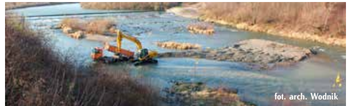
Wsypanie żwiru do Wisłoki poniżej stopnia w Dębicy.

Ponadto, w ramach projektu, na 10 fragmentach Wisłoki wdrożono działania mające na celu odtworzenie siedlisk dla ryb. Prace obejmowały: ułożenie głazów w korycie – w celu zróżnicowania warunków przepływu wody, dozowanie żwiru – w celu zapewnienia odpowiedniego podłoża żwirowego dla zwiększenia obszaru tartlisk dla ryb (tzw. „karmienie rzeki”) oraz umożliwienie kontrolowanej erozji bocznej (czyli rozmycie brzegów rzeki). W wytypowanych odcinkach, do koryta Wisłoki został wsypany żwir w ilości ok. 10 000 m 3 . Materiał umieszczony był w postaci poprzecznych i podłużnych pryzm. Dodatkowo w korycie rzeki Wisłoki ułożono wielkogabarytowe głazy w różnych konfiguracjach (ażurowe, grupowe, deflektory), w celu zróżnicowania warunków przepływu wody. Zakupionych zostało także siedemnaście działek, o łącznej powierzchni 7,28 ha znajdujących się w obrębie potencjalnej, aktywnej erozji bocznej brzegów.