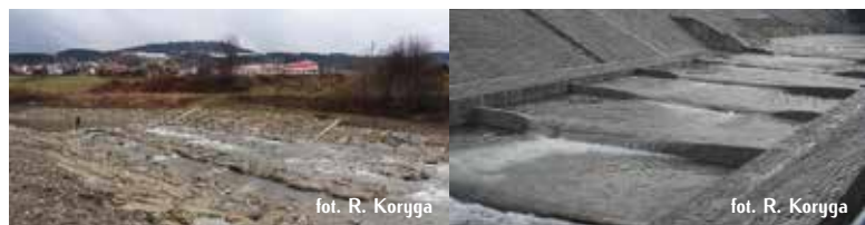
fol. R. Koryga

Ponadto w ramach projektu zainicjowano działania mające na celu przywrócenie na ponad 20 ha obszarze pierwotnych siedlisk nadrzecznych (zarośli, lasów łęgowych). Odtworzono łączność populacji i ciągłość występowania cennych przyrodniczo i ważnych dla funkcjonowania doliny Białej Tarnowskiej gatunków zwierząt – kumaka górskiego i skójki gruboskorupowej. Rozpoczęto reintrodukcję łosia, w ramach której przeprowadzono inwentaryzację potencjalnych miejsc zarybień oraz wpuszczono do Białej i jej dopływów 200 tys. sztuk wylęgu niezerującego.