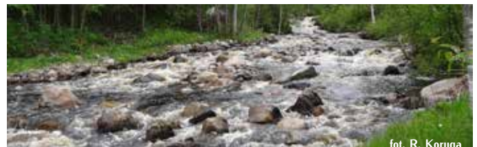
Odtworzone bystrze na rzece Saajoki.

Projekt renaturyzacji obejmował odcinek o długości 2,3 km, na którym różnica wysokości wynosi 36 m (spadek 1,6%). Odtworzono tutaj trzy bystrza o łącznej długości 1300 m oraz szerokości wahającej się od 3–23 m. Usunięte poprzednio głazy, zostały na powrót umieszczone w korycie, w celu zapewnienia jak największej różnorodności morfologicznej dna. Przywrócić to rzece naturalną sekwencję bystrze-płoso. Do koryta jest również dosypywany żwir, oczyszczony uprzednio z drobniejszych frakcji (piaszczystych, mulistych), co