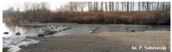
Ażurowe ułożenie głazów w korycie Wisłoki.

Projekt współfinansowany był przez Unię Europejską, ze środków Europejskiego Funduszu Rozwoju Regionalnego, w ramach Programu Operacyjnego Infrastruktura i Środowisko 2007–2013. Całkowity koszt Projektu: 10,9 mln zł przy 85% dofinansowaniu. Obecnie działania renaturalizacyjne w zlewni Wisłoki są kontynuowane w ramach projektu „Likwidacja barier migracyjnych dla organizmów wodnych na rzece Wistoce i jej dopływach – Ropie oraz Jasiołce”. Jest on współfinansowany w ramach Programu Operacyjnego Infrastruktura i Środowisko 2014–2020, Oś II Ochrona środowiska, w tym adaptacja do zmian klimatu (Działanie 2.1 Adaptacja do zmian klimatu wraz z zabezpieczeniem i zwiększeniem odporności na klęski żywiołowe, w szczególności katastrofy naturalne) oraz monitoring środowiska (typ projektów 2. Realizacja zadań służących osiągnięciu dobrego stanu wód). Planowany całkowity koszt realizacji projektu: 28,7 mln zł, w tym dofinansowanie UE 85% tj. 24,4 mln zł, czas realizacji 2018–2021 r.