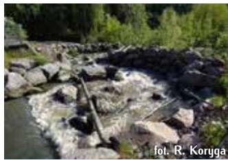
fol. R. Koryga