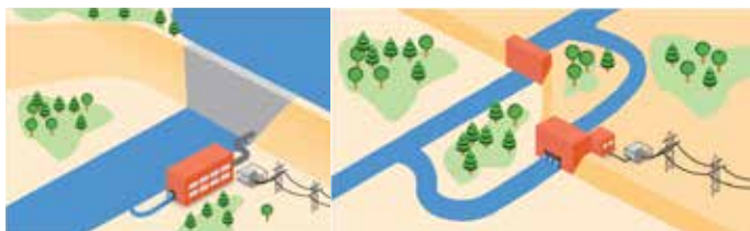
Schematy elektrowni przyzaporowej [1] oraz derywacyjnej [2].

Przez całe tysiąclecia ludzkość wykorzystywała wody rzek jako łatwo dostępne źródło energii. Podstawowym elementem elektrowni wodnej jest turbina, w której następuje zmiana energii potencjalnej wody w energię kinetyczną, a ta z kolei w prądnicy elektrycznej (hydrogeneratorze) jest zamieniana na energię elektryczną. Z reguły na rzekach karpackich realizowane są elektrownie przyzaporowe tj. wykorzystujące różnicę poziomów wody bezpośrednio w miejscu jej spiętrzenia i wielkości spadu wynikającym z wysokości przegrody piętrzącej. Innym typem są elektrownie derywacyjne, w przypadku których wielkość uzyskiwanego spadku nie jest ograniczona wysokością przegrody piętrzącej wodę lecz jest związana z rozwiązaniem opartym o kanał derywacyjny.