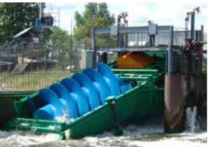
fol. Pesymista CC BY-SA 3.0