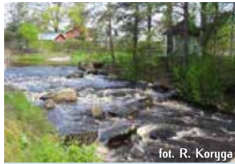
fol. R. Koryga