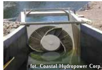
fol. Coastal Hydropower Corp.

Ryby sptywające kanałami turbin hydroelektrowni są narażone na zniszczenie. Wysokość strat w rybostracie jest uzależniona w pierwszej kolejności od typu turbin, szybkości obrotów wirnika oraz wysokości przegrody. Duże znaczenie ma wybór odpowiedniego typu turbiny – konieczne jest stosowanie turbin wolnoobrotowych o dużym rozstawie łopatek. Współcześnie zaleca się użycie przyjaznych dla ryb turbin, takich jak śruba Archimedes, VLH czy Vortex oraz fizycznych i behawioralnych barier chroniących ryby przez dostawaniem się do turbin.