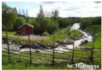
fol. R. Koryga