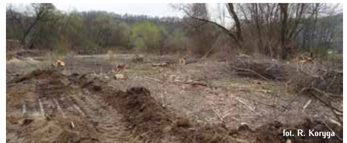
fol. R. Koruga

rzek. Wycinka nadrzecznych lasów nie jest rozwiązaniem problemu powstawania zatorów z napławionego drewna, powodujących lokalne podpiętrzenia wody i uszkodzenia mostów. Aby rozwiązać ten problem należy przebudować obiekty mostowe zwiększając ich światło i lokalizując filary poza korytem.