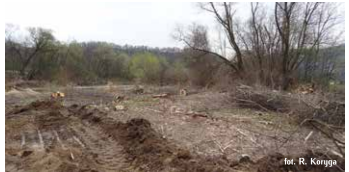
fol. R. Koryga

nia zatorów z napławionego drewna, powodujących lokalne podpiętrzenia wody i uszkodzenia mostów. Aby rozwiązać ten problem należy przebudować obiekty mostowe zwiększając ich światło i lokalizując filary poza korytem.