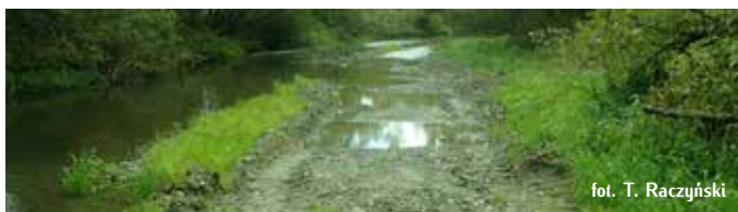
fol. T. Raczyński

Wydobywanie piasku i żwiru z koryt powoduje wcinanie się i obniżenie poziomu dna rzeki. Prowadzi to do szeregu negatywnych oddziaływań – zagrożających zarówno przyrodzie rzek górskich, jak i interesom człowieka. Pobór żwiru z koryt cieków i kamieńców przyczynia się do fizycznego niszczenia siedlisk przyrodniczych, powoduje również niszczenie tarlisk i miejsc życia cennych przyrodniczo gatunków ryb i minogów (zniszczenia bezpośrednie, ograniczanie dostępności substratu tarłowego, zwiększone zamulenie itp.).