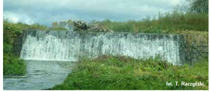
fol. T. Raczyński

podgórszych. Bystrza tym lepiej spełniają swoją funkcję ekologiczną, zapewniając wędrówkę ryb i makrobentosu, im spadek płyty bystrza jest łagodniejszy, a ułożenie głazów zbliżone do naturalnego rozmieszczenia ziaren w korycie.