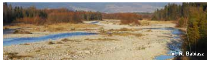
fol. R. Babiasz

Regulacja rzek i potoków polega na tworzeniu trwałych i regularnych brzegów koryta oraz na utrwalaniu dna. Prace hydrotechniczne zmieniają geometrię koryta i strukturę podłoża, likwidują naturalne formy erozyjne i odsypiskowe (np. łachy), modyfikują przepływ wody w korycie, zmieniają stan brzegów i uniemożliwiają naturalny przebieg procesów formujących morfologię koryt. Działania tego typu powodują niszczenie siedlisk oraz zmniejszenie różnorodności organizmów wodnych. Ochrona rzek górskich polega przede wszystkim na zachowaniu ich naturalności, utrzymaniu odpowiedniej szerokości i struktury koryt rzecznych.