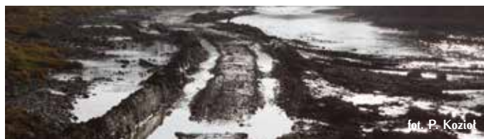
fol. P. Kozioł

Wydobywanie piasku i żwiru z koryt powoduje wcinanie się i obniżenie poziomu dna rzeki. Prowadzi to do szeregu negatywnych oddziaływań – zagrożających zarówno przyrodzie rzek górskich, jak i interesom człowieka. Pobór żwiru z koryt cieków i kamieńców przyczynia się do fizycznego niszczenia siedlisk przyrodniczych, powoduje również niszczenie tarlisk i miejsc życia cennych przyrodniczo gatunków ryb i minogów (zniszczenia bezpośrednie, ograniczanie dostępności substratu tarłowego, zwiększone zamulenie itp.).