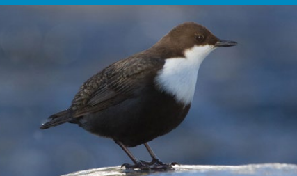
White-throated Dipper (Cinclus cinclus)

Mały ptak wróblowy o krępej sylwetce i krótkim zadartym ogonie. Ubarwienie brązowe, brunatno-czarne z białą piersią i gardłem. Zasadla szybko płynące cieki, w szczególności górskie potoki, z urwistymi, zalesionymi brzegami, zimną, czystą wodą oraz najlepiej kamienistym podłożem. Posiada nietypowe jak na ptaka śpiewającego przystosowania do życia nad ciekami. Większość czasu spędza w korytach potoków stojąc, chodząc lub skacząc po kamie-