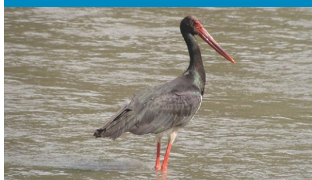
fol. Silar - Own work, CC BY-SA 3.0, https://commons.wikimedia.org/w/index.php?curid=4461613