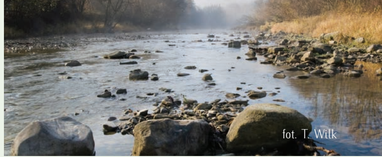
fol. T. Wilk

W tym numerze biuletynu, oprócz wspomnianego tososia, przedstawimy kolejne ważne z punktu widzenia ochrony europejskiej przyrody gatunki ptaków i ssaków związane z doliną Wisłoki.