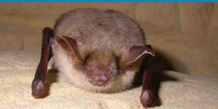
Myotis myotis

Jeden z największych krajowych nietoperzy: rozpiętość skrzydeł ok. 45 cm, waga od 26–40 g. Futro na grzbiecie szarobrązowe, na brzuchu białe i biało-żółte, ucho i pyszczek jasne, błony lotne ciemne. Kolonie rozrodzce zlokalizowane przeważnie na strychach budynków, wyjątkowo w podziemiach liczą zazwyczaj od kilkunastu do kilkuset osobników, choć znane są również zgrupowania znacznie bardziej liczne. Zimowanie trwa od późnej jesieni do początku kwietnia. Nocki duże hibernują w podziemiach – sztolniach, fortach, piwnicach i jaskiniach, choć bywa, że zimą znajdują się również na nie przemarzających strychach. Nocki duże odżywiają się drobnymi bezkręgowcami (głównie dużymi chrząszczami). Swoje ofiary często chwytają na ziemi. Wśród zagrożeń, dla gatunku wymienia się: prace remontowe dachów i strychów prowadzone w okresie rozrodu nietoperzy tj. od 15.04. do 15.09, stosowanie toksycznych środków konserwacji drewna, wycinkę lub nadmierne przycinanie drzew w bezpośrednim otoczeniu kolonii rozrodzycy, intensywne zewnętrzne oświetlenie budynków z koloniami, utratę tras migracji i żerowisk – niszczenie liniowych elementów krajobrazu, wielkoobszarowe wylesienia, fragmentację obszarów leśnych.