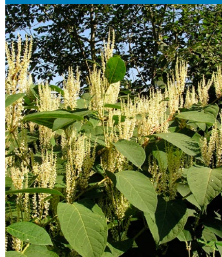
Acer negundo