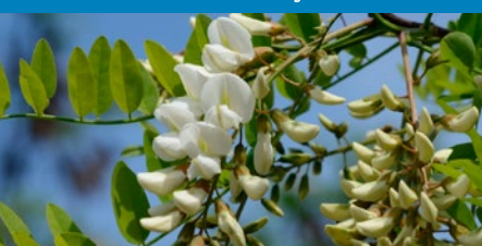
fot. Radio Tonreg from Vienna, Austria – Robinia pseudoacacia*Uploaded by Jacopo Werther, CC BY 2.0, https://commons.wikimedia.org/w/index.php?curid=25210761

Robinia akacja pochodzi z Ameryki Północnej. Do Europy sprowadzona została jako drzewo ozdobne. Ma małe wymagania glebowe, lecz jest rośliną światłolubną. Wysusza podłoże w głębszych warstwach, natomiast wierzchnią warstwę wzbogaca w azot – w konsekwencji następuje rozwój roślinności azotolubnej (np. pokrzyw). Ponadto wy-