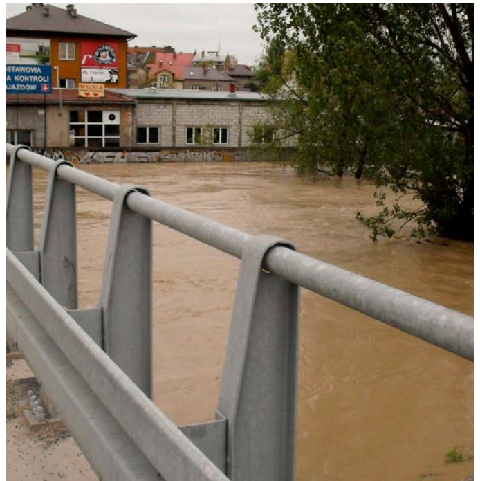
Powódź na Jasiołce w roku 2010

Próby ujarznienia żywiołu poprzez regulację w górskich biegach rzek doprowadziły do zmiany przebiegu koryt z wielonurtowego lub meandrującego na jednonurtowy, a zawężone i wyprostowane koryta uległy nawet kilkumetrowemu pogłębieniu. Obwałowania i regulacje rzek nie zmniejszyły jednak zagrożeń powodziowych, a jedynie spowodowały szybsze odprowadzanie wody w dół biegu rzeki, przesuwając problem poniżej. Próby ujarznienia rzek górskich są kosztowne, a ich efekty nietrwałe. Rzeki, szukając utraconej równowagi, w trakcie kolejnych wezbrań systematycznie odzyskują wydarte im przez człowieka tereny. Zbiorniki zaporowe na rzekach ulegają zamuleniu, a zabudowa brzegów jest podmywana i niszczona na skutek obniżania się dna.