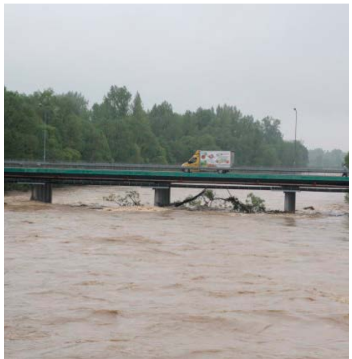
Wezbrana Soła w Kętach w 2014 r.

Próby ujarznienia żywiołu poprzez regulację w górskich biegach rzek doprowadziły do zmiany przebiegu koryt z wielonurtowego lub meandrującego na jednonurtowy, a zawężone i wyprostowane koryta uległy nawet kilkumetrowemu pogłębieniu. Obwałowania i regulacje rzek nie zmniejszyły jednak zagrożenia powodziowego, a jedynie spowodowały szybsze odprowadzanie wody w dół biegu rzeki, przesuwając problem poniżej. Próby ujarznienia rzek górskich są kosztowne, a ich efekty nietrwałe. Rzeki, szukając utraconej równowagi, w trakcie kolejnych wezbrań systematycznie odzyskują wydarte im przez człowieka tereny. Zbiorniki zaporowe na rzekach ulegają zamuleniu, a zabudowa brzegów jest podmywana i niszczone na skutek obniżania się dna.