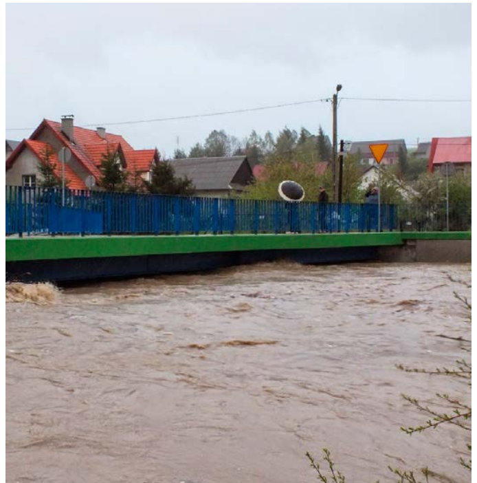
Wezbrana Czarna Orawa w Jabłonce w 2014 r.

Próby ujarznienia żywiołu poprzez regulację w górskich biegach rzek doprowadziły do zmiany przebiegu koryt z wielonurtowego lub meandrującego na jednonurtowy, a zawężone i wyprostowane koryta uległy nawet kilkumetrowemu pogłębieniu. Obwałowania i regulacje rzek nie zmniejszyły jednak zagrożenia powodziowego, a jedynie spowodowały szybsze odprowadzanie wody w dół biegu rzeki, przesuwając problem poniżej. Próby ujarznienia rzek górskich są kosztowne, a ich efekty nietrwałe. Rzeki, szukając utraconej równowagi, w trakcie kolejnych wezbrań systematycznie odzyskują wydarte im przez człowieka tereny. Zbiorniki zaporowe na rzekach ulegają zamuleniu, a zabudowa brzegów jest podmywana i niszczona na skutek obniżania się dna.