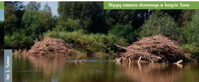
Wyspy rumoszu drzewnego w korycie Sanu