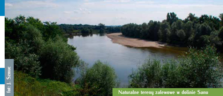
Naturalne tereny zalewowe w dolinie Sanu

Ważna jest więc obecność odkładających się nanosów piasku, żwiru i kamieni - przybrzeżnych lub śródkorytowych. W ten sposób kształtuje się różnorodność siedlisk rzecznych, a płycizny sprzyjają żerowaniu narybku. Istotne jest także występowanie miejsc o naprzemiennie szybszym i wolniejszym prądzie wody oraz przegłębieni i płycizn. Takie siedliska wpływają na bogactwo ichtiofauny (gatunków ryb). Żwir jest więc niezbędnym elementem ekosystemu rzecznego. Jego nadmierny pobór z koryta zaburza