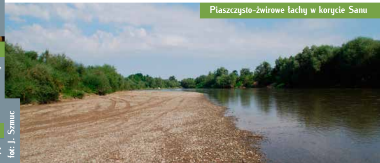
Piaszczysto-żwirowe łachy w korycie Sanu